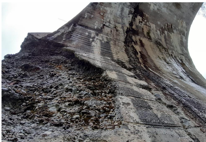
Figura 1 – Lo stato dei luoghi (documentazione fotografica).

Dopo essersi recati sul luogo, si è constatato quindi che i motivi dell'urgenza erano: